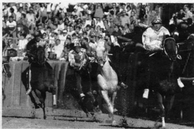
UN MOMENTO AVVINCENTE DEL PALIO EDIZIONE 2010

Domenica prossima alle 15,30 presso la Chiesa della Confraternita di San Girolamo a Costigliole, a cura dell'Associazione "Confraternita di San Gerolamo" e con il patrocinio del Comune, sarà visionabile il primo Palio della storia a noi pervenuto. Il drappo, chiamato in gergo "sendallo", uno Stendardo del Palio che la Confraternita della Misericordia di Costigliole si aggiudicò nella corsa del 1785. Dal Cinquecento in poi, infatti, la forma del Palio cambia totalmente, assumendo una foggia che si è conservata sostanzialmente immutata nei secoli fino ai giorni nostri. Compare il "sendallo", ovvero una tela rettangolare istoriata a forma di labaro di circa 100 per 70 centimetri, confezionata in un tessuto misto seta/cotone, detta di zendale o "sangallo". A questo stendardo è unito nella sua parte terminale un drappo di tessuto prezioso (appunto il "pallium"), solitamente arrotol-