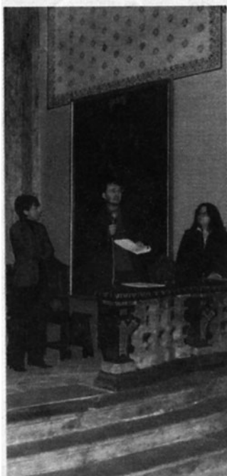
CONFRATERNITA DELLA MISERICORDIA