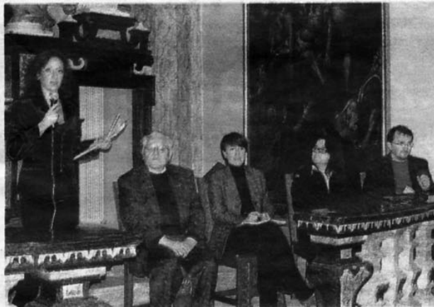
La presentazione dell'attività della Confraternita di San Gerolamo