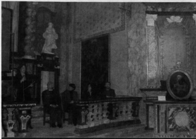
Un momento della presentazione delle opere restaurate alla Confraternita di San Girolamo di Costigliole. Alle spalle dei relatori la grande tela della Deposizione di Cristo dalla croce (anonimo) e uno degli ovali opera di Michelangelo Pittatore

Un'acquasantiera in marmo del 1698, l'imponente pulpito ligneo risalente alla metà del XVIII secolo, di particolare pregio perché ingloba anche il confessionale, vari dipinti su tela i cui colori e i volti tornano a brillare dopo il lavoro di restauro (tra cui gli ovali dipinti da Michelangelo Pittatore), la statua lignea "Madonna con Bambino" opera dello scultore settecentesco Bartolomeo Varale di Moncalvo e lo stendardo del Palio del 1785, anno in cui la Confraternita della Misericordia di Costigliole (quella che era la Confraternita dei Battuti Neri) si aggiudicò il primo premio. Sono le